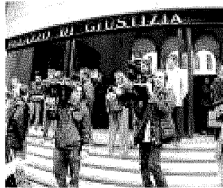
Palazzo di Giustizia

Il caso è particolarmente interessante, perché si tratta della prima volta che le forze dell'ordine sequestrano in particolare fumetti a carat-